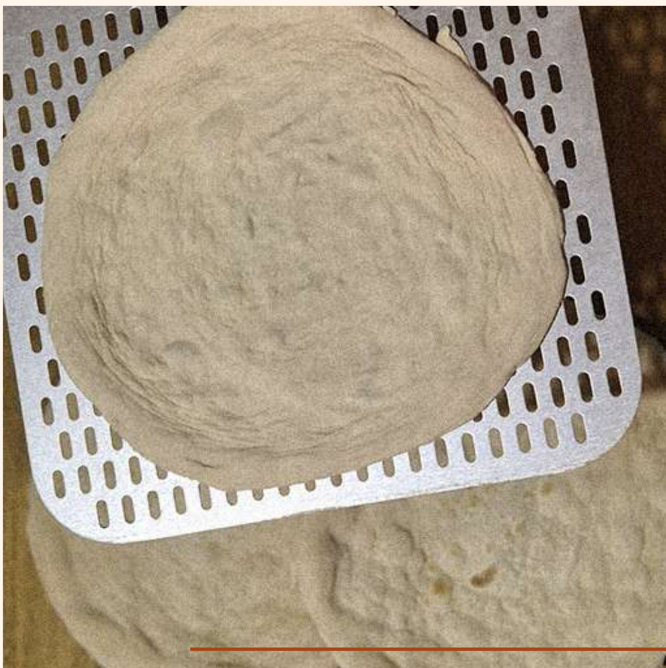
PRE PIZZAS DE MASA MADRE