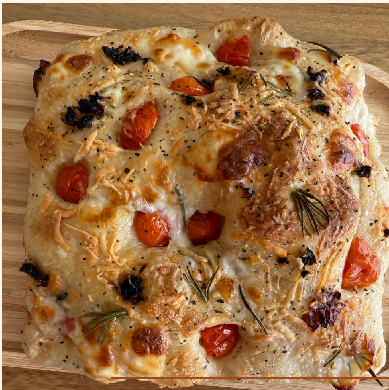
FOCACCIA DE MASA MADRE