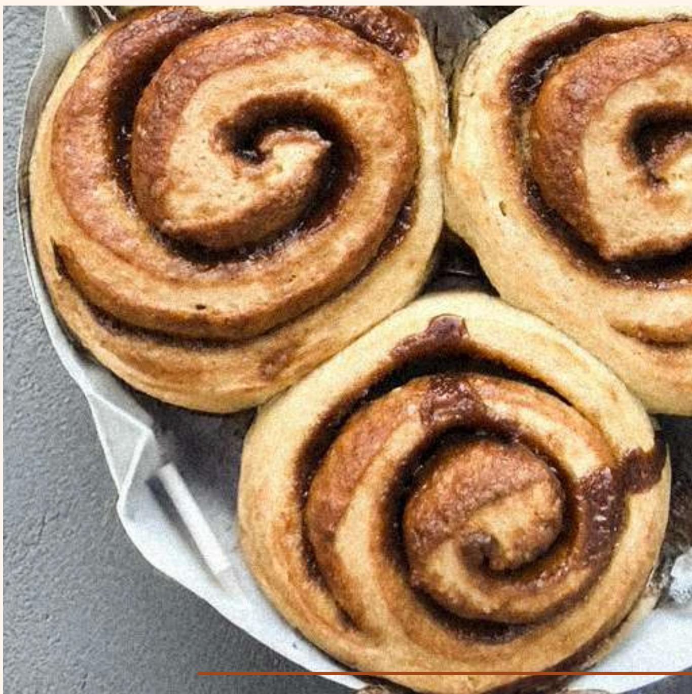
HOGAZA DE MASA MADRE