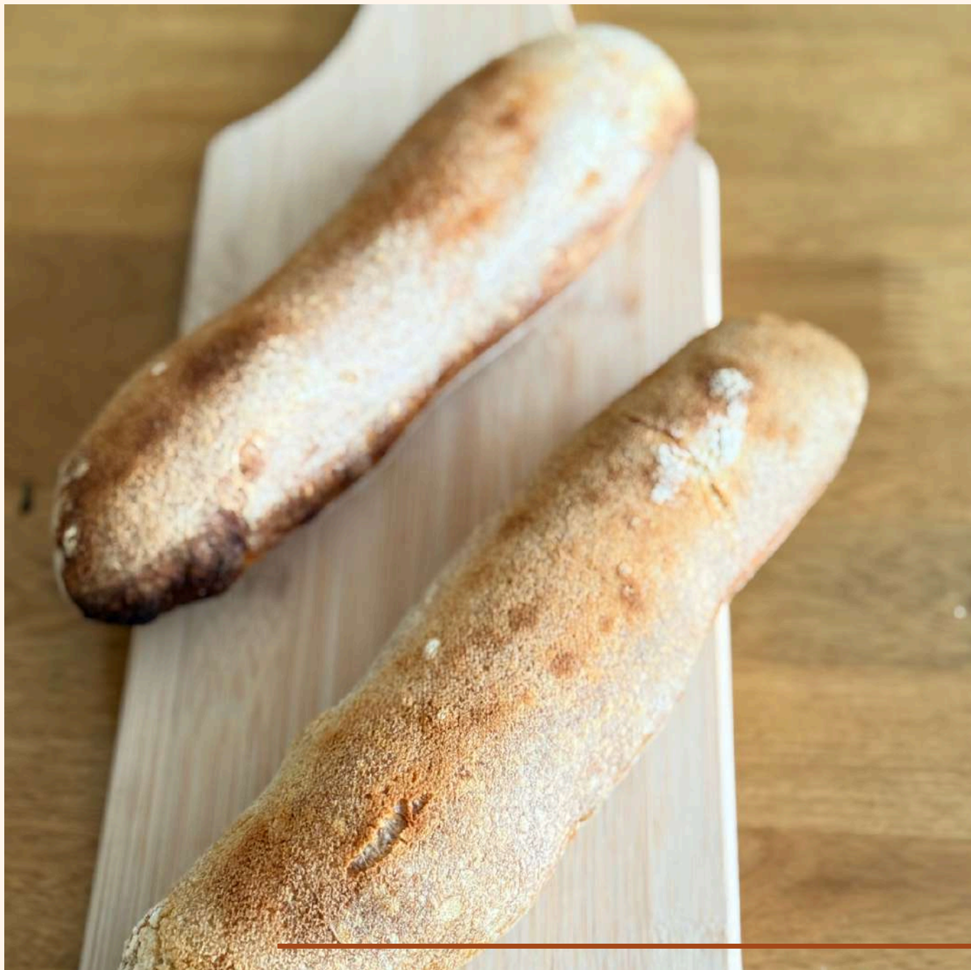
PAN DE MASA MADRE