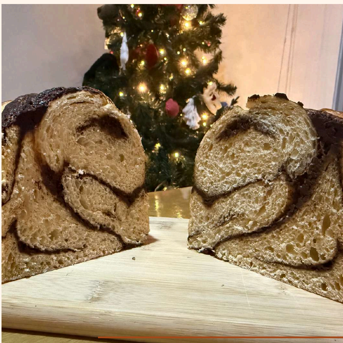
HOGAZA DE MASA MADRE